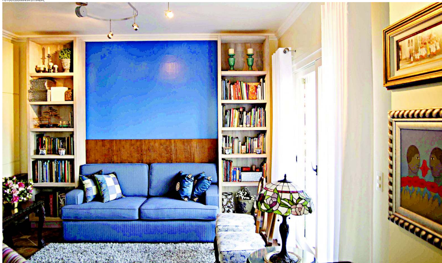
Mudar a posição dos móveis pode ajudar a maximizar as energias do ambiente; sofá de frente para a porta recebe os bons fluidos